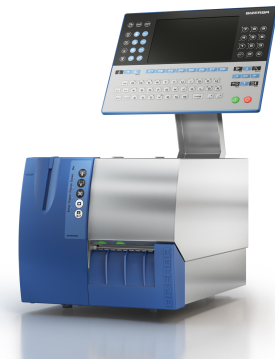
GLPmaxx 80 Ausführung Edelstahl