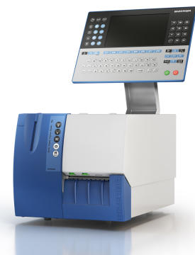
GLPmaxx 80 Ausführung Stahl lackiert